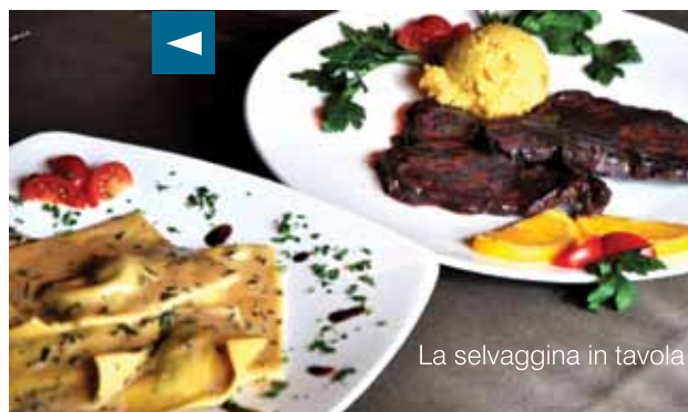
La selvaggina in tavola