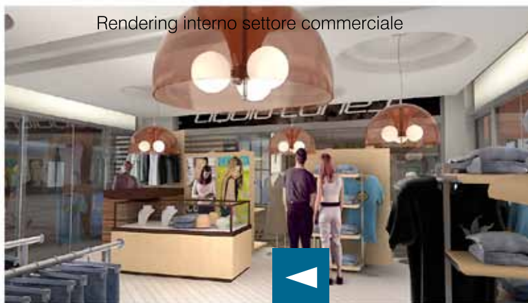
Rendering interno settore commerciale

In ultimo quindi chiederei a tutti i santhiatesi di scriverci sulla nostra pagina di facebook per farci capire se le iniziative sviluppate fino a ora sono piaciute e eventualmente per svilupparne di nuove assieme.