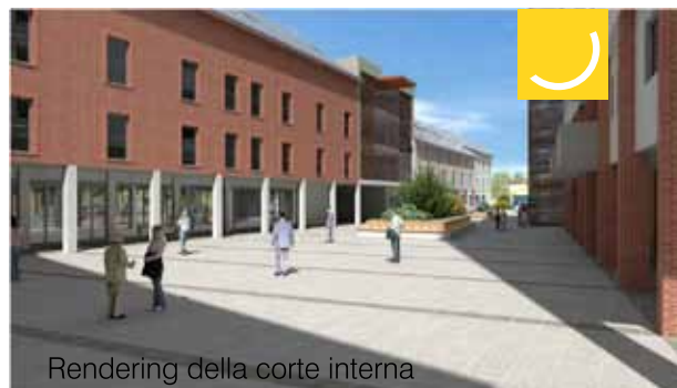
Rendering della corte interna

Abbiamo pensato così che Santhià Centro non dovesse avere solo un nome ma anche un marchio identificativo che servisse da "volto" per l'intero progetto. Da questo segno e dai suoi colori, l'arancione e l'ocra (tinte che richiamano non a caso il territorio vercellese) sono state declinate tutte le espressioni comunicative.