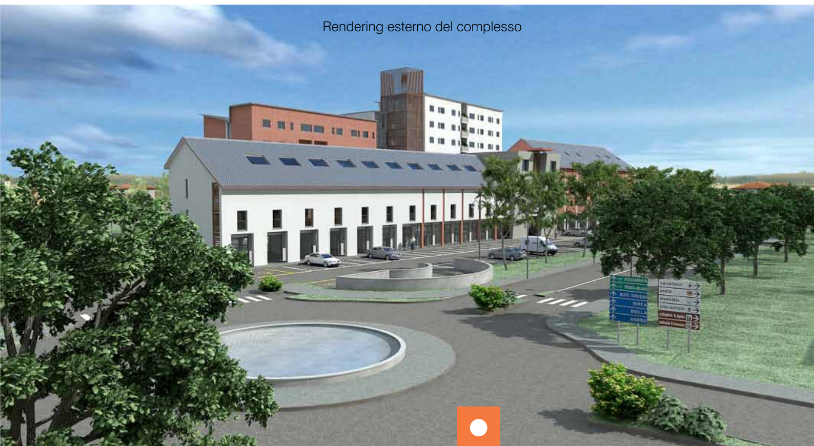
Rendering esterno del complesso

Dopo aver caricato tutte le informazioni on-line, il piano di comunicazione si è concentrato su come creare attesa e attenzione attorno a questa nuova "avventura". Per questo, il cinque novembre scorso, è