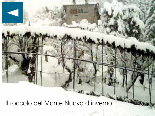
Il roccolo del Monte Nuovo d’inverno