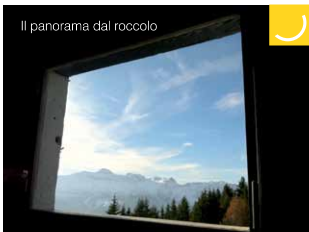
Il panorama dal roccolo